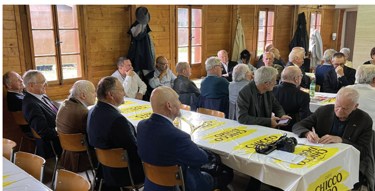
Les invités et les membres de l'Association Nam suivent les orateurs avec attention.